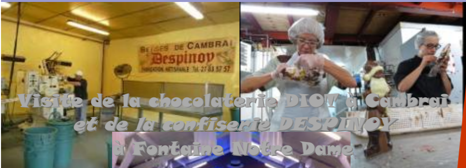
Visite de la chocolaterie DIOT à Cambrai et de la confiserie DESPINOV à Fontaine Notre Dame